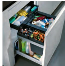
BOXX55/60-R Bio Individuelle Montage auf Rollschubführungen

Die Produkte der Linie BOXX vereinen höchste Funktionalität mit erstklassigem Design. Das umfasst zum Beispiel den Eimer für eine maximale Befüllung, ein grosses herausziehbares Ablagefach – und vieles mehr.