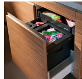
ZK BOXX 55/60 Bio Industrielle Montage auf Zargenschubblenden von Blum, Grass, Hettich