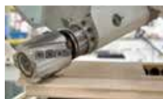
Maschine bei der Arbeit