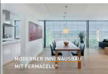
MODERNER INNENAUSBAU MIT FERMACELL®

Ein schönes Gebäude verdient es, schön zu bleiben – von innen und aussen