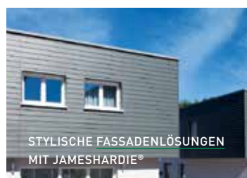
STYLISCHE FASSADENLÖSUNGEN MIT JAMESHARDIE®